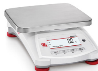
Modelos PX12001 y PX12001/E

Cuatro teclas rápidas permiten un manejo sencillo de varias modalidades de pesaje.