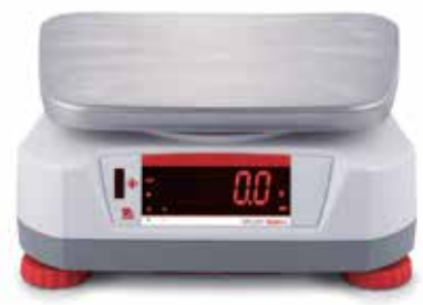
Display trasero con sensor «Touchless» integrado