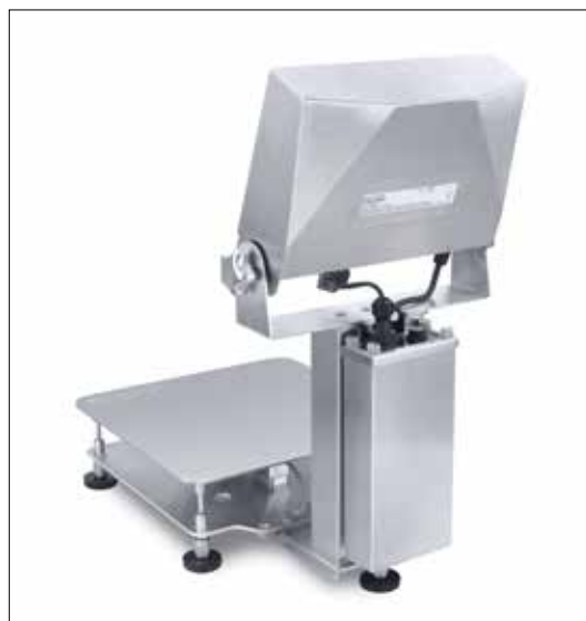
Soporte para batería externa opcional para los modelos i-D61XWE